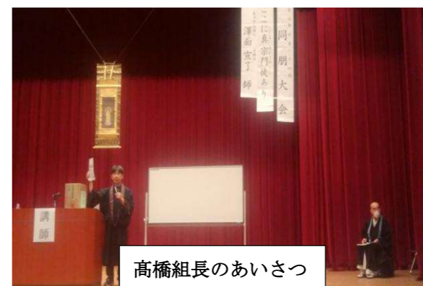
高橋組長のあいさつ