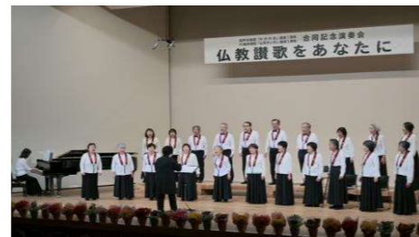
混声合唱団かがやき