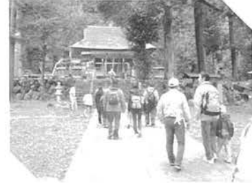
↑ 昨年の様子(伊香具神社にて)