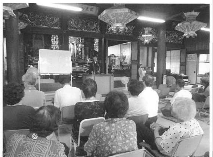
誓海寺での暁天講座