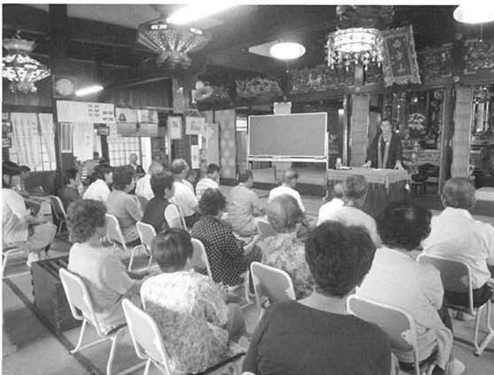
浄教寺での暁天講座